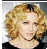
Veronica Ciccone SHOWGIRL

«Madonna, seguace della dottrina ebraica della Kabbalah, è preoccupata per le minacce di estremisti islamici, e ha assunto due esperti addetti alla sicurezza. Il pop nel mirino dei terroristi?