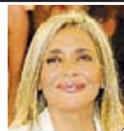
Mara Venier CONDUTTRICE

«Madonna, seguace della dottrina ebraica della Kabbalah, è preoccupata per le minacce di estremisti islamici, e ha assunto due esperti addetti alla sicurezza. Il pop nel mirino dei terroristi?