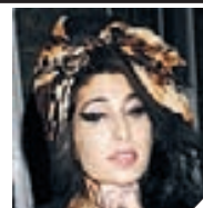
Amy Winehouse CANTANTE

«Mara Venier torna a lavorare a Canale 5 dopo nove anni di assenza: affiancherà Paola Perego ne La fattoria seguendo dal Brasile le imprese dei "contadini". Dalle stelle alle... stalle!